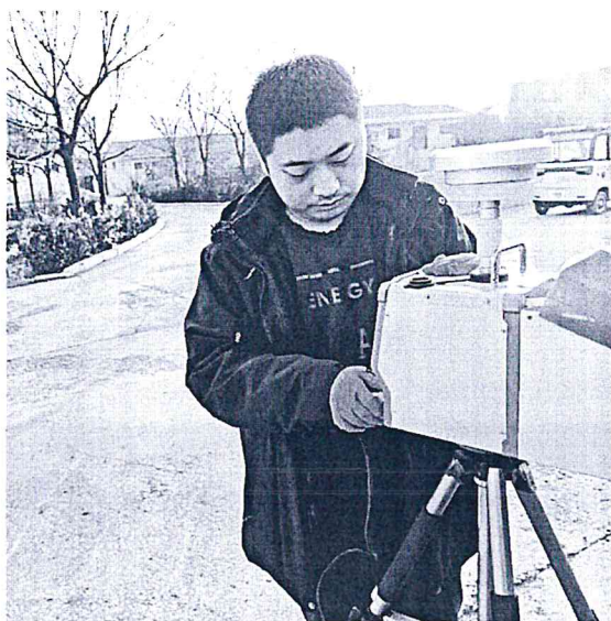
图 2-1 环境空气采样照片