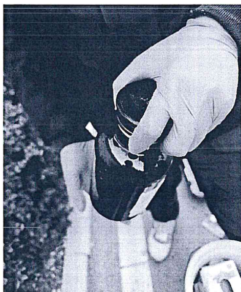
图 2-3 地下水采样照片