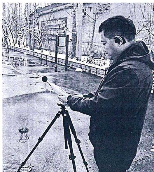
图 2-4 噪声采样照片